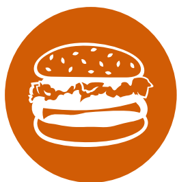
BURGER (siehe unten)